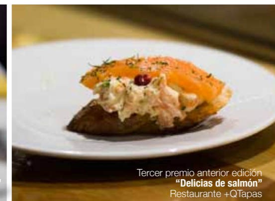
Tercer premio anterior edición "Delicias de salmón" Restaurante +QTapas

Más información en www.pozuelodealarcon.org