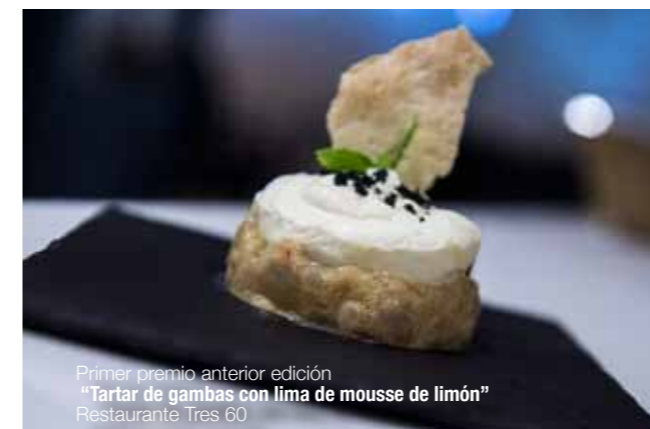
Primer premio anterior edición "Tartar de gambas con lima de mousse de limón" Restaurante Tres 60