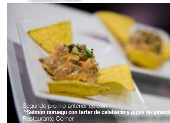
Segundo premio anterior edición "Salmón noruego con tartar de calabacín y pipas de girasol" Restaurante Córner