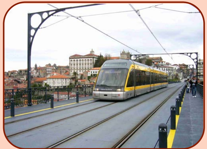
Metro Ligero en la ciudad portuguesa de Oporto

Para los peatones, la convivencia con el Metro Ligero en los tramos en superficie es relativamente fácil. Cada vez que un